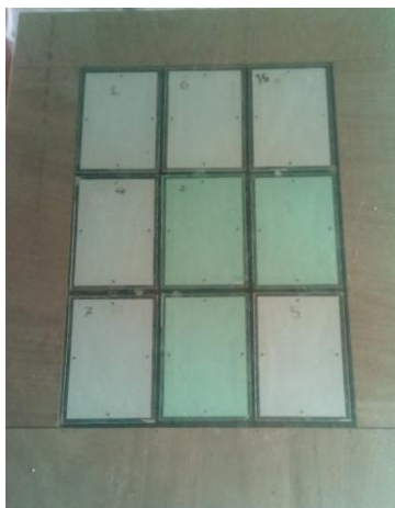
Photo du plancher en réalisation, pas terminé. Version définitive dans deux à trois semaines.